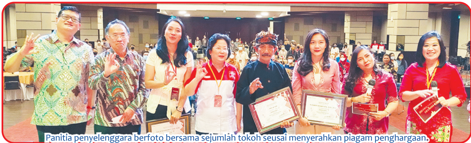
Panitia penyelenggara berfoto bersama sejumlah tokoh usai menyerahkan piagam penghargaan.