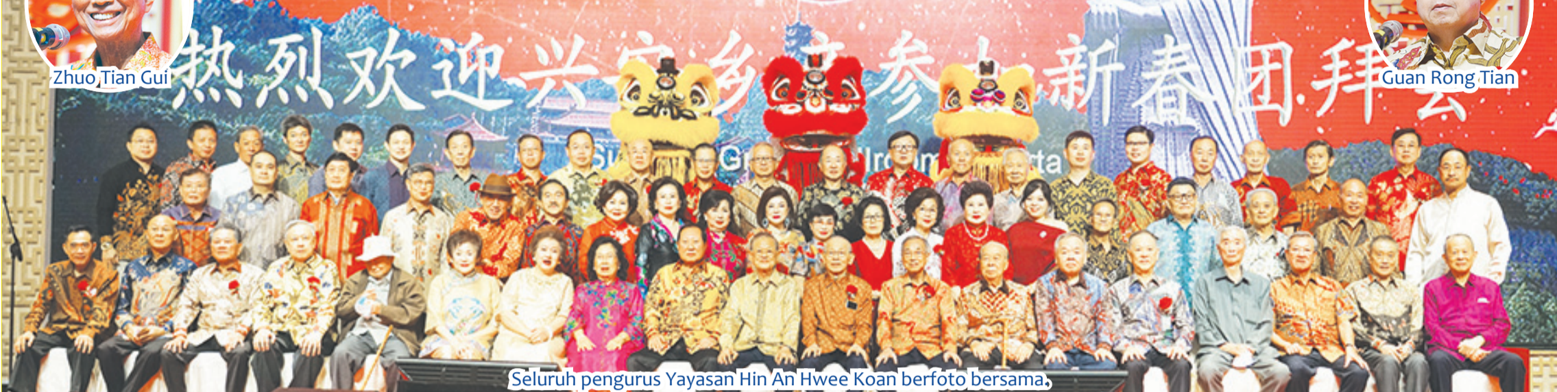
Seluruh pengurus Yayasan Hin An Hwee Koan berfoto bersama.

JAKARTA (IM) - Sejak pandemi Covid-19 mereda, suasana Tahun Baru Imlek semakin kental, berbagai ormas dan asosiasi di berbagai provinsi dan kota di Indonesia menyelenggarakan perayaan Tahun Baru Imlek di berbagai daerah di Nusantara ini. Yayasan Hin An Hwee Koan, Jumat (3/2) lalu juga menyelenggarakan Perayaan Tahun Baru Imlek 2023, di lobi Restoran Sun City di Jakarta.