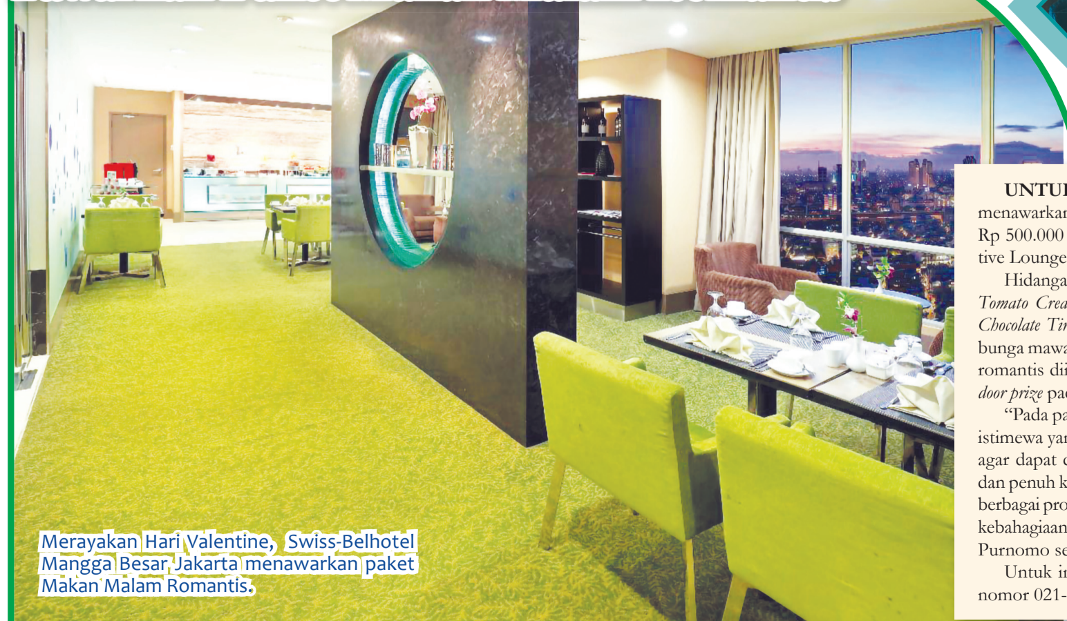
Merayakan Hari Valentine, Swiss-Belhotel Mangga Besar, Jakarta menawarkan paket Makan Malam Romantis.