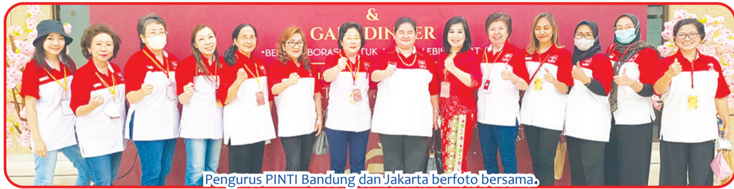
Pengurus PINTI Bandung dan Jakarta berfoto bersama.

mengucapkan selamat atas suksesnya acara tersebut melalui video.